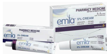
Crema anestésica EMLA