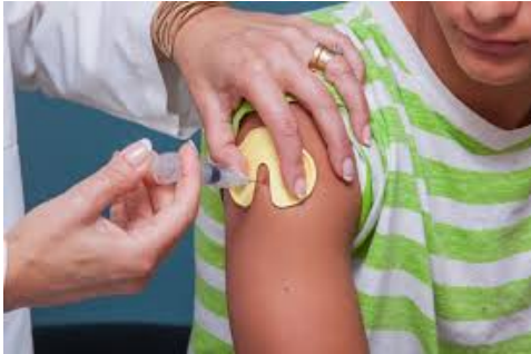
Bloqueador de vacunas